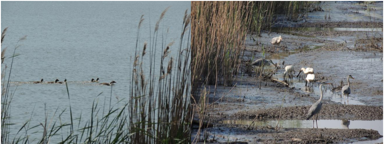
Дивља гуска дунавка са гушчићима