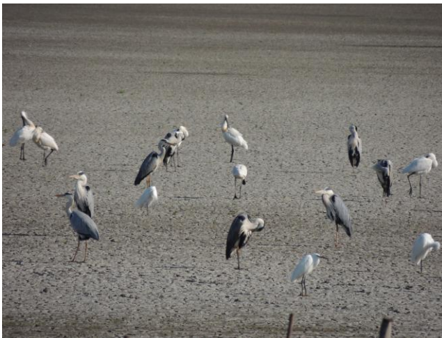
Чапље кашикаре, сиве и мале беле чапље