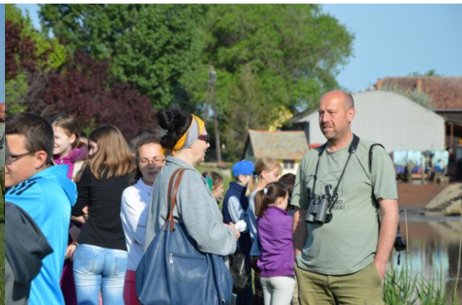
Учесници светског дана птица селица