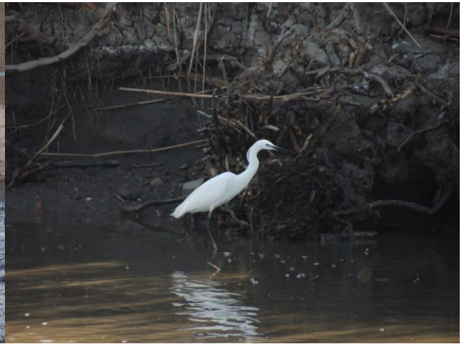
Мала бела чапља