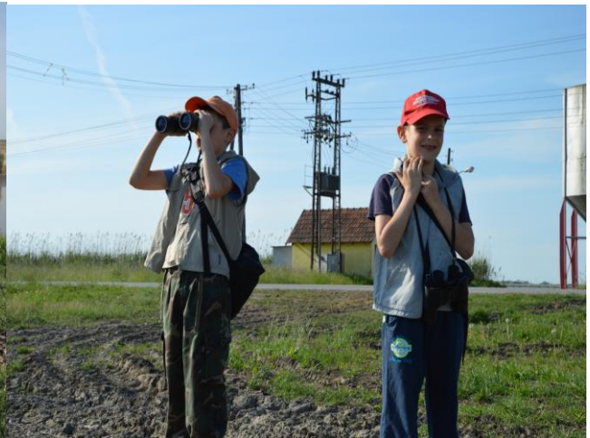
Учесници светског дана птица селица