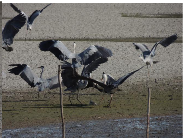
Сиве чапље се туку око хране